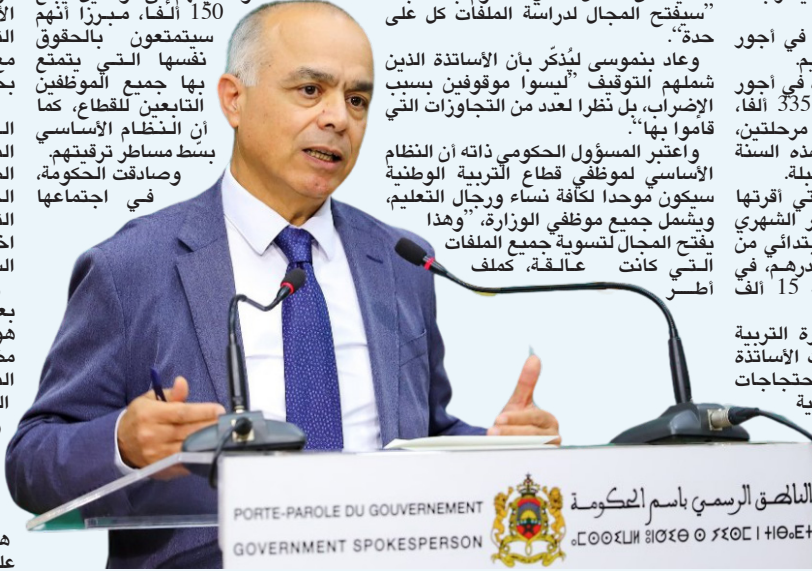
الناطق الرسمي باسم الحكومة GOVERNMENT SPOKESPERSON

الأكاديميات الجهوية للتربية والتكوين". وأشار إلى أن عدد الأساتذة أطر الأكاديميات الجهوية للتربية والتكوين الذين تم تغيير وضعيتهم إلى موظفين، يبلغ 150 ألفاً، مبرزاً أنهم سيتمتعون بالحقوق نفسها التي يتمتع بها جميع الموظفين التابعين للقطاع، كما أن النظام الأساسي بسط مساطر ترقيتهم. وصادقت الحكومة، في اجتماعها