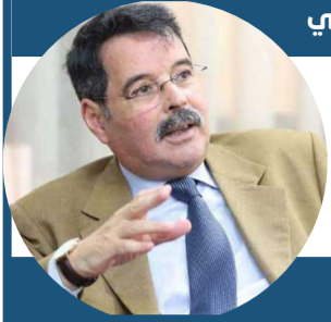
طالع السعود الأطلسي