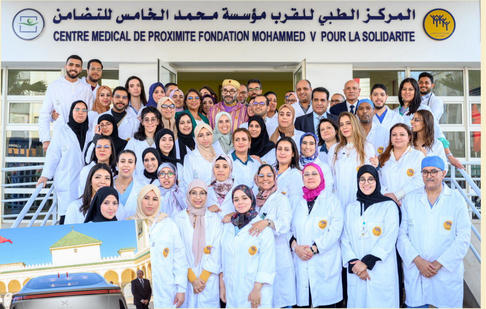
المركز الطبي للقرب مؤسسة محمد الخامس للتضامن CENTRE MEDICAL DE PROXIMITE FONDATION MOHAMMED V POUR LA SOLIDARITE

المجتمعي والسعي إلى حل نهائي متوافق عليه. وأصبحت الأقاليم الجنوبية تستقطب استثمارات كبيرة خاصة بعد تأمين العبور بمعبر الكركرات من قبل القوات المسلحة الملكية بامر ملكي، والذي شكل اليوم عبورا تنمويا يجمع بين قارتين أوروبا. لقد أصبح النداء الملكي هو القاعدة الأساسية للتفاوض والذي عنوانه الأكبر "التفاوض ليس على الصحراء ومغربيتها لكن من أجل حل سلمي لهذا النزاع الإقليمي المفتعل" لذلك أكثر من مئة دولة على المستوى العالمي تؤكد على جدية مشروع الحكم الذاتي وأصبح مجلس الأمن يصوت إيجابا على التقارير المتعلقة بالصحراء المغربية خاصة بعد 2007. وما اعطى للدبلوماسية المغربية نفسا قويا هو الخطابات الملكية التي تعتمد الوضوح والطموح "نقول لأصحاب المواقف الغامضة والمزدوجة بأن المغرب لن يقوم معهم بأي خطوة اقتصادية أو تجارية لا تشمل الصحراء المغربية" وقد أقرت الأمم المتحدة استمرارية الموائد المستديرة التي تؤكد على أن الجزائر طرف أساسي في هذه القضية وليس ملاحظ كما تدعي. فقد مكنت عودة المغرب لحضن عائلته المؤسساتية الإفريقية، التي تعد تكريسا للرؤية الملكية من أجل إفريقيا قوية، وتأخذ زمام مصيرها بيدها، أمانة ومزدهرة، من تدعيم خيار المملكة من أجل تعاون جنوب-جنوب تضامني ومثمر لجميع الأطراف، وكذا تعزيز حضورها على الأصدع السياسية والاقتصادية والأمنية. والأكيد أن عودة المغرب للاتحاد الإفريقي أضفت دينامية جديدة على