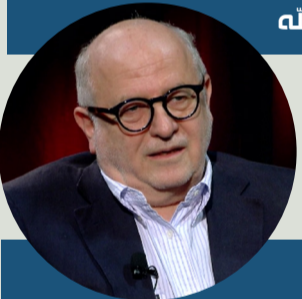
خير الله خير الله

الملك محمد السادس أوضح في جوابه على الاعتراف الإسرائيلي بمغربية الصحراء بأن ذلك القرار "صائب كونه يدعم الأسانيد القانونية للحق والحقوق التاريخية الراسخة للمغرب في أقاليمه الصحراوية"، وأن "السيادة الفعلية للدولة المغربية