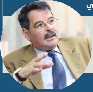
طالع السعود الأطلسي