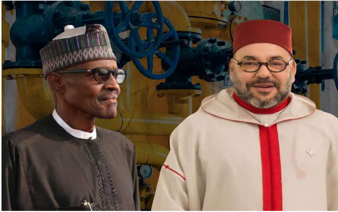
مختلف الدولة الساحلية في غرب إفريقيا (بنين والتوغو وغانا والكوت ديفوار وليبيريا وسيراليون وغينيا وغينيا بيساو وغامبيا والسنغال وموريتانيا)، ليصل الى طنجة، ومنها الى قاديس بإسبانيا.

صادق المجلس التنفيذي الفدرالي لنيجيريا على دخول شركة البترول الوطنية النيجيرية في اتفاقية مع المجموعة الاقتصادية لدول غرب إفريقيا (إيكواس) من أجل بناء خط أنابيب الغاز بين نيجيريا والمغرب. وكشف وزير الدولة النيجيري للموارد النفطية، تيمبيري سيلفا، عن الموافقة على الاتفاقية، في تصريح للصحافة عقب اجتماع للمجلس التنفيذي الفدرالي النيجيري برئاسة نائب الرئيس ييمي أوسينباجو، عقد اليوم الأربعاء في القصر الرئاسي في أبوجا، وفق ما ذكرت وكالة الأنباء النيجيرية.